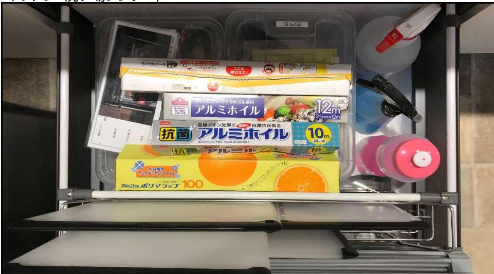
まな板 大3枚 小1枚