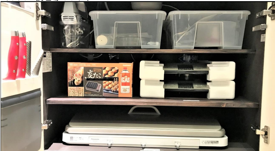
包丁 4本 バーミックス クイジナート付属